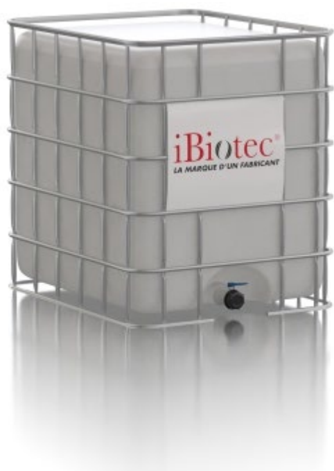
GRV Container 1000 L